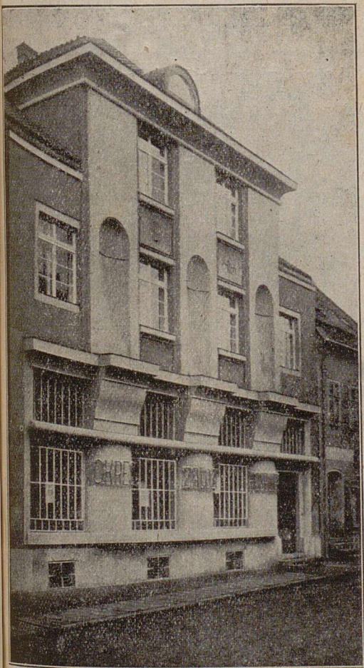
Okr. záložna hospodářská v Žel. Brodě.