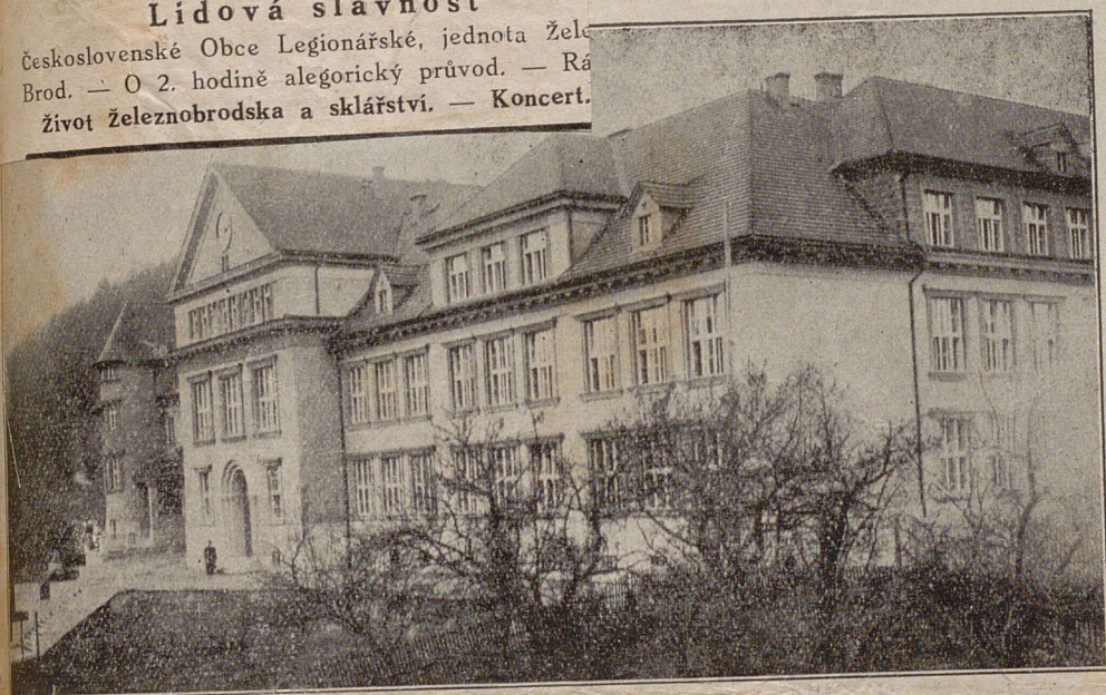
Státní odborná škola pro průmysl sklářský v Železném Brodě.

Československé Obce Legionářské, jednoty Želez- Brod. — O 2. hodině alegorický průvod. — Rá- život Železnobrodsko a sklářství. — Koncert.